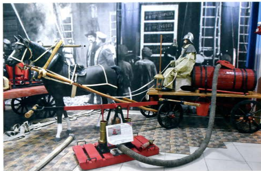
Конно-бочечный пожарный ход, 30-е гг. XX в., с. Белое Новосибирской области