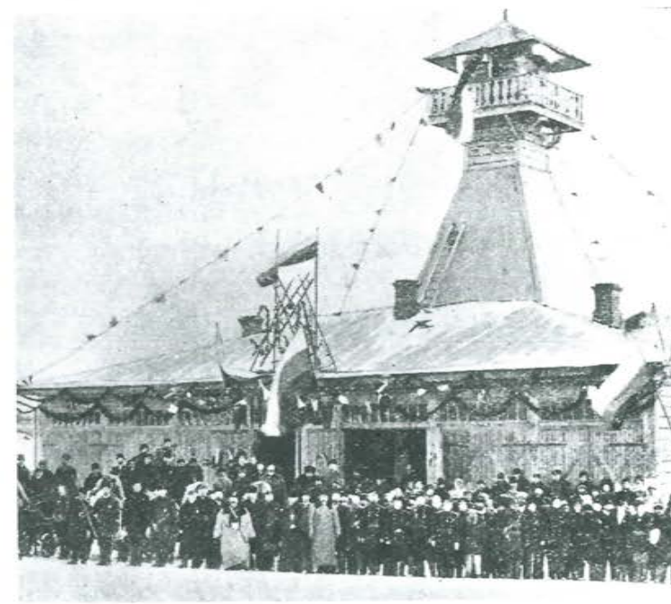
Новосибирск. Освещение пожарного депо п. Новониколаевск