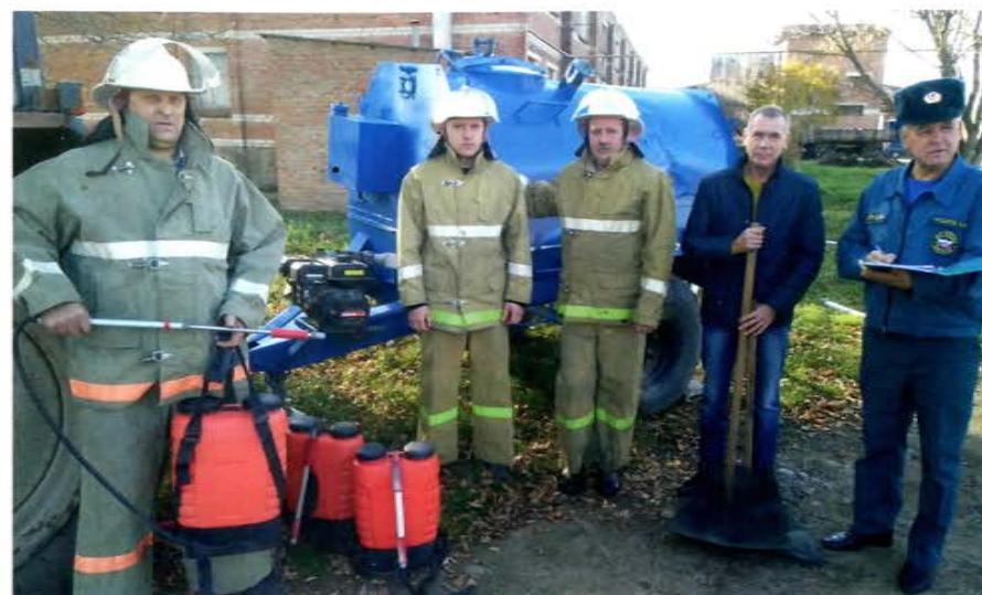
5-й отряд ДПК, Краснодарский край

9 февраля 2010 года в университете состоялось торжественное мероприятие, посвященное присвоению официального статуса спасательному отряду ДГТУ «Донской».