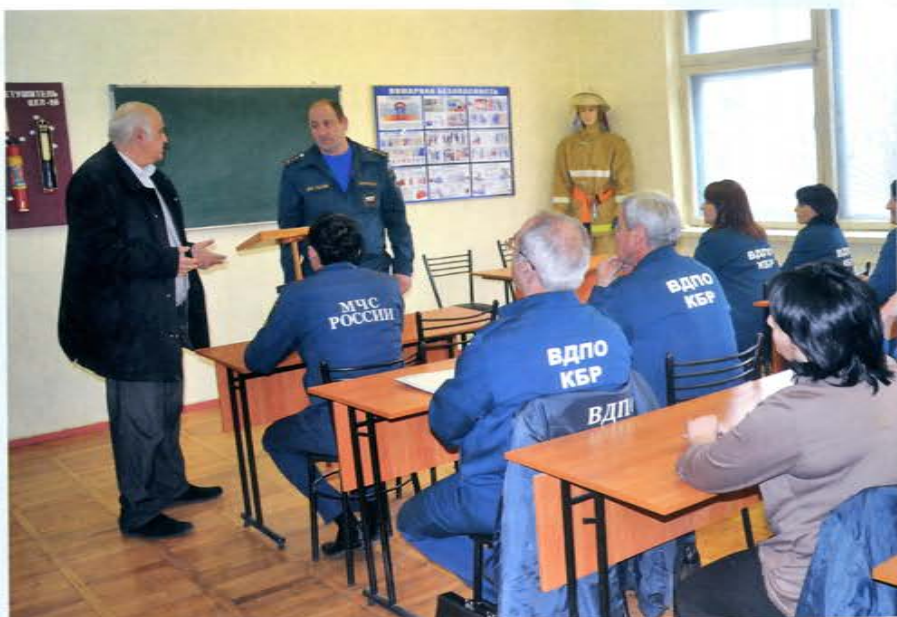
День добровольца, Кабардино-Балкарская Республика