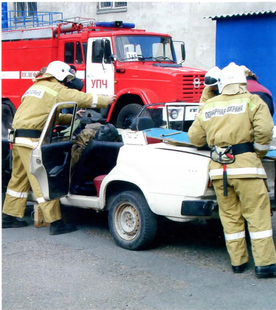
Красноярский край, ДСПСО «Звезда» АСР при ДТП

2 апреля 2021 г. в деревне Покрово-Иртышское Омского муниципального района Омской области в результате совместной работы органов муниципальной власти при содействии Главного управления МЧС России по Омской области состоялось открытие подразделения добровольной пожарной команды.