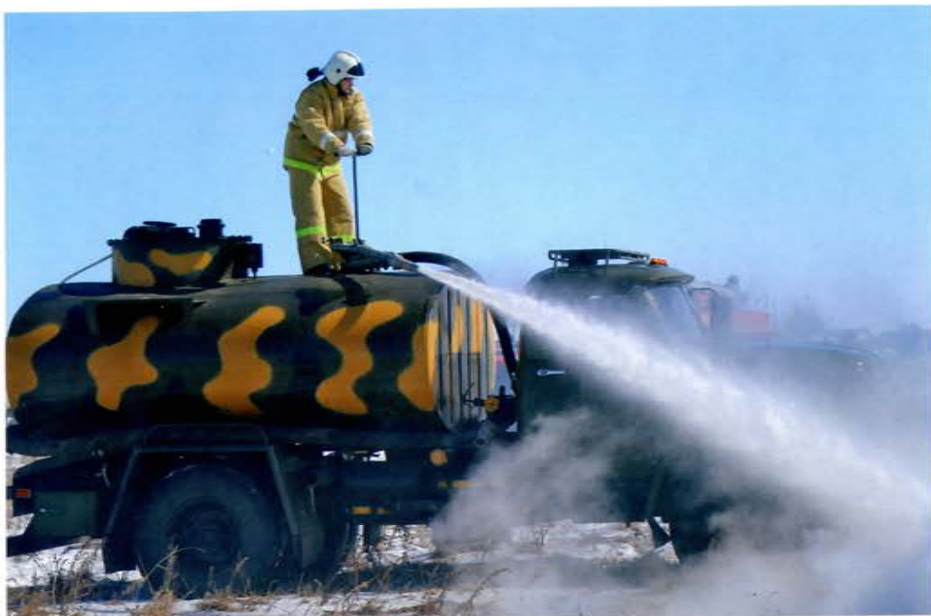
Амурский пожарный сконструировал из бензовоза уникальную машину для тушения огня