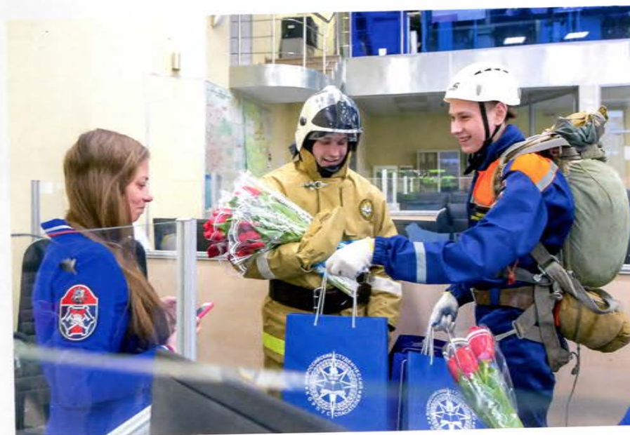
ВСКС поздравляет сотрудниц ЦУКС с 8 марта