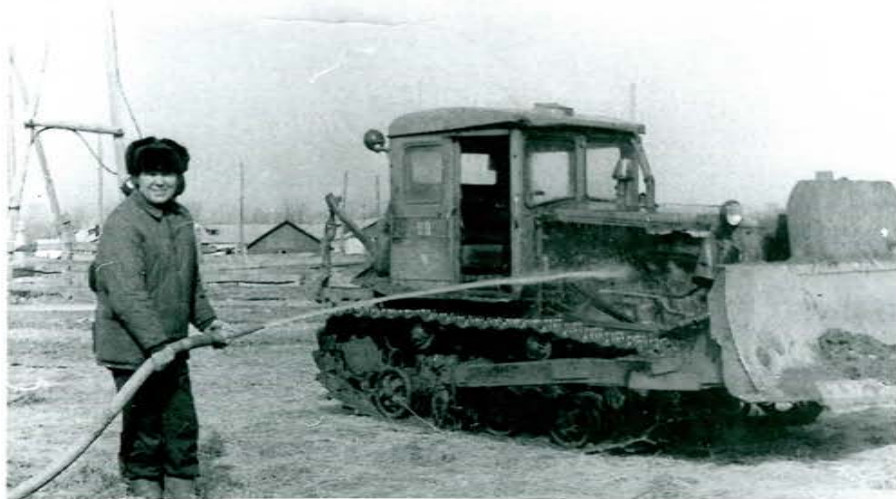
ДПК Партизанского городского округа Приморска