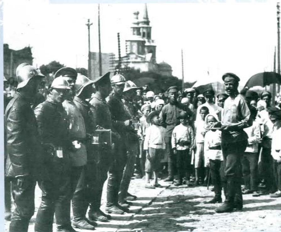
Вольное пожарное общество Екатеринбурга

Из решения заседания президиума Остяко-Вогульского окружного исполнительного комитета от 16 апреля 1932 г.: «Признать целесообразным организовать в Остяко-Вогульске профессиональную пожарную дружину в составе 8 человек».