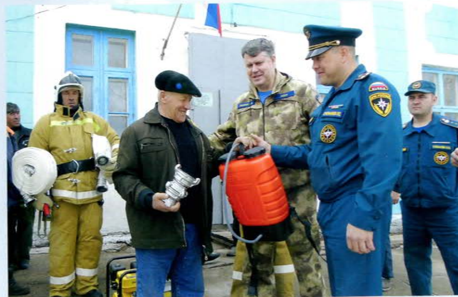
Приаргунский район, ДПД с. Бырка