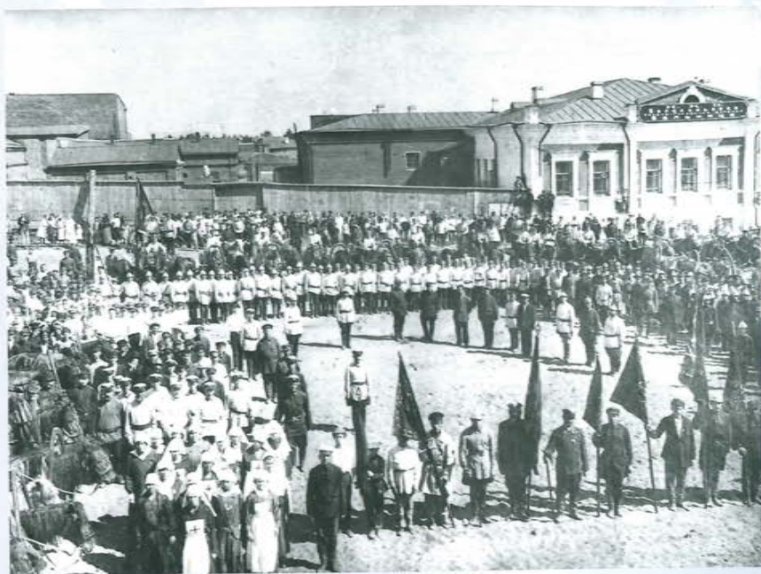
Десятилетие пожарного общества г. Барнаула

В 1830–1850 гг. на Алтае, в частности в Барнауле, произошло несколько крупных пожаров. Это вынудило создать в городе при полиции первую пожарную команду. В 1863 г., когда почти полностью выгорели привилегированные кварталы, барнаульский городничий добился сметы на создание штатной пожарной команды.