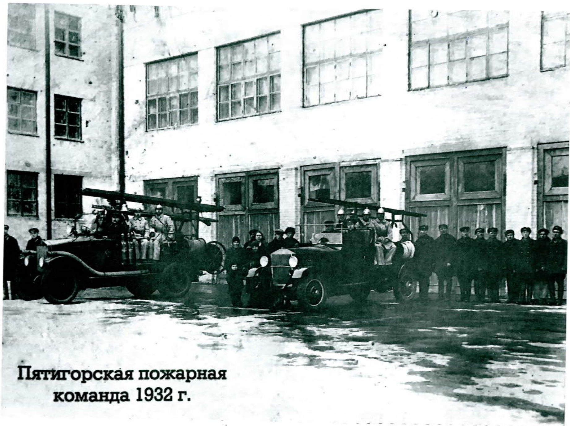
Пятигорская пожарная команда 1932 г.