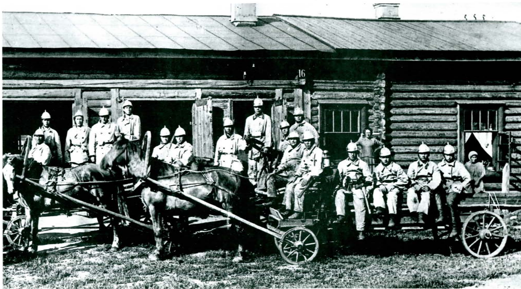
Команда пожарных частей г. Шадринска, 1920 г.

Пожарная охрана Югры развивалась вместе с округом: постепенно, день за днем, накапливался опыт, менялась структура, увеличивалось количество сотрудников и единиц техники. Добровольные пожарные дружины для борьбы с огнем были созданы в первые годы советской власти.