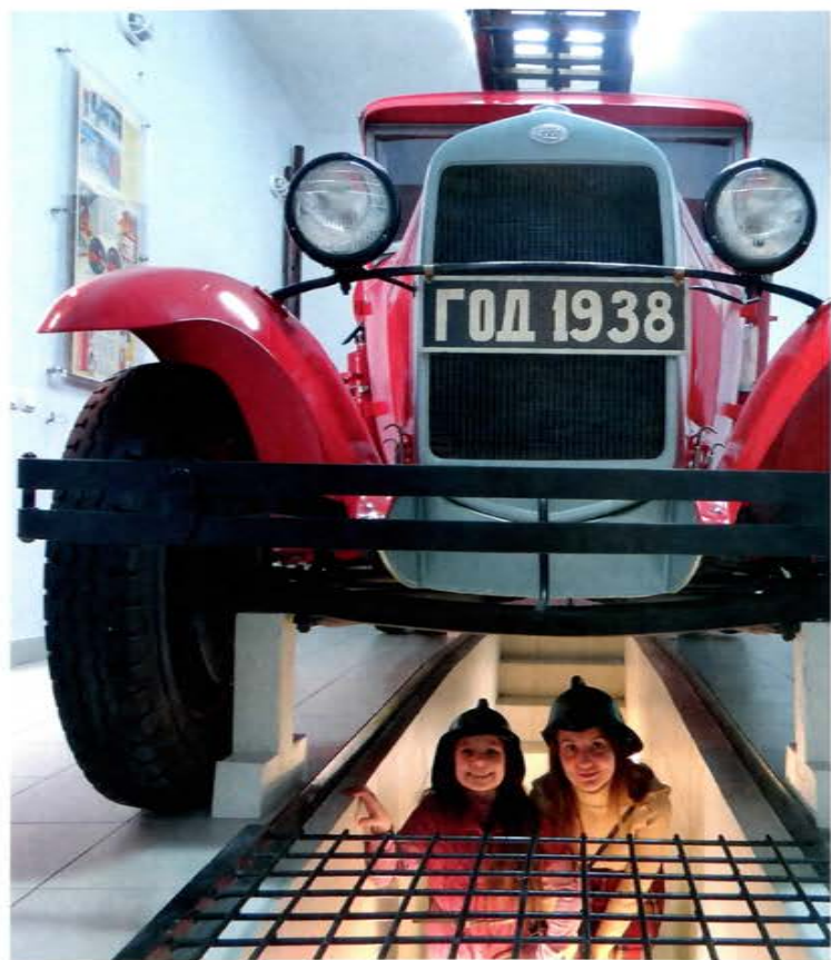
Музей пожарной охраны г. Ульяновска

Численность пожарной команды Симбирска (ныне Ульяновска), организованной 10 января 1818 г., была незначительна. По штату 1831 г. насчитывался 51 человек. К концу XIX века в административном отношении город был поделен на три района, в каждом из которых была создана пожарная команда и построены здания пожарных депо с каланчой. Численность личного состава к концу века насчитывала всего около 100 служащих.