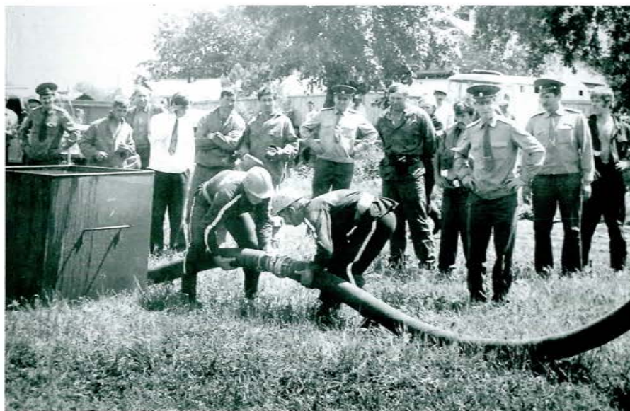
Соревнования ДПО в Амурской области, 1980-е гг.