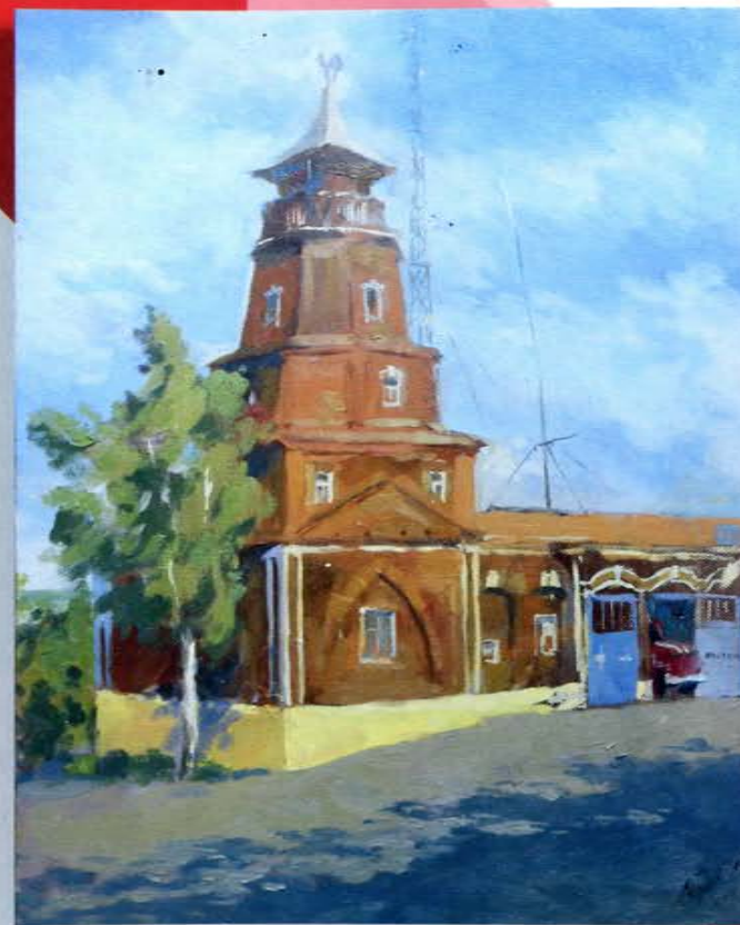
Этад пожарной каланчи г. Сердобск Пензенской области. 10 ПСЧ ФПС ФГКУ "5-й отряд ФПС по Пензенской области". /40x50, х.м., 2018г./