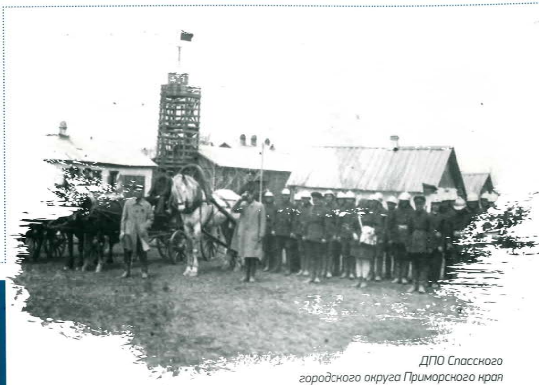
ДПО Спасского городского округа Приморского края