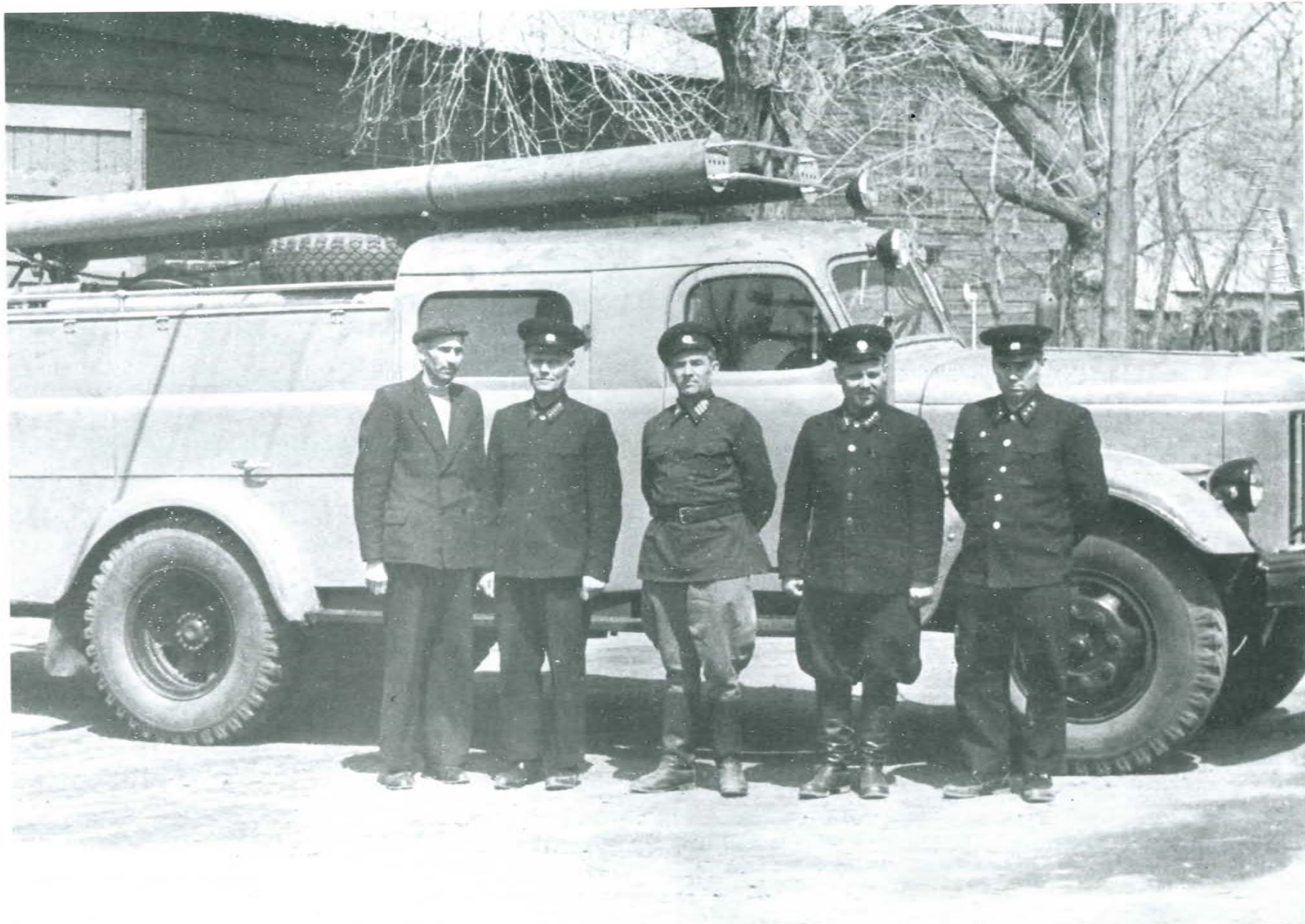
Команда ДПО Спасского городского округа Приморска