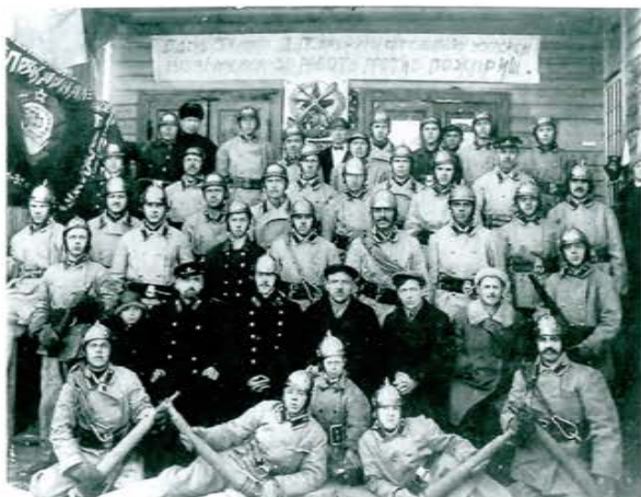
ДПО лесозавода №37/38, 1929 г.