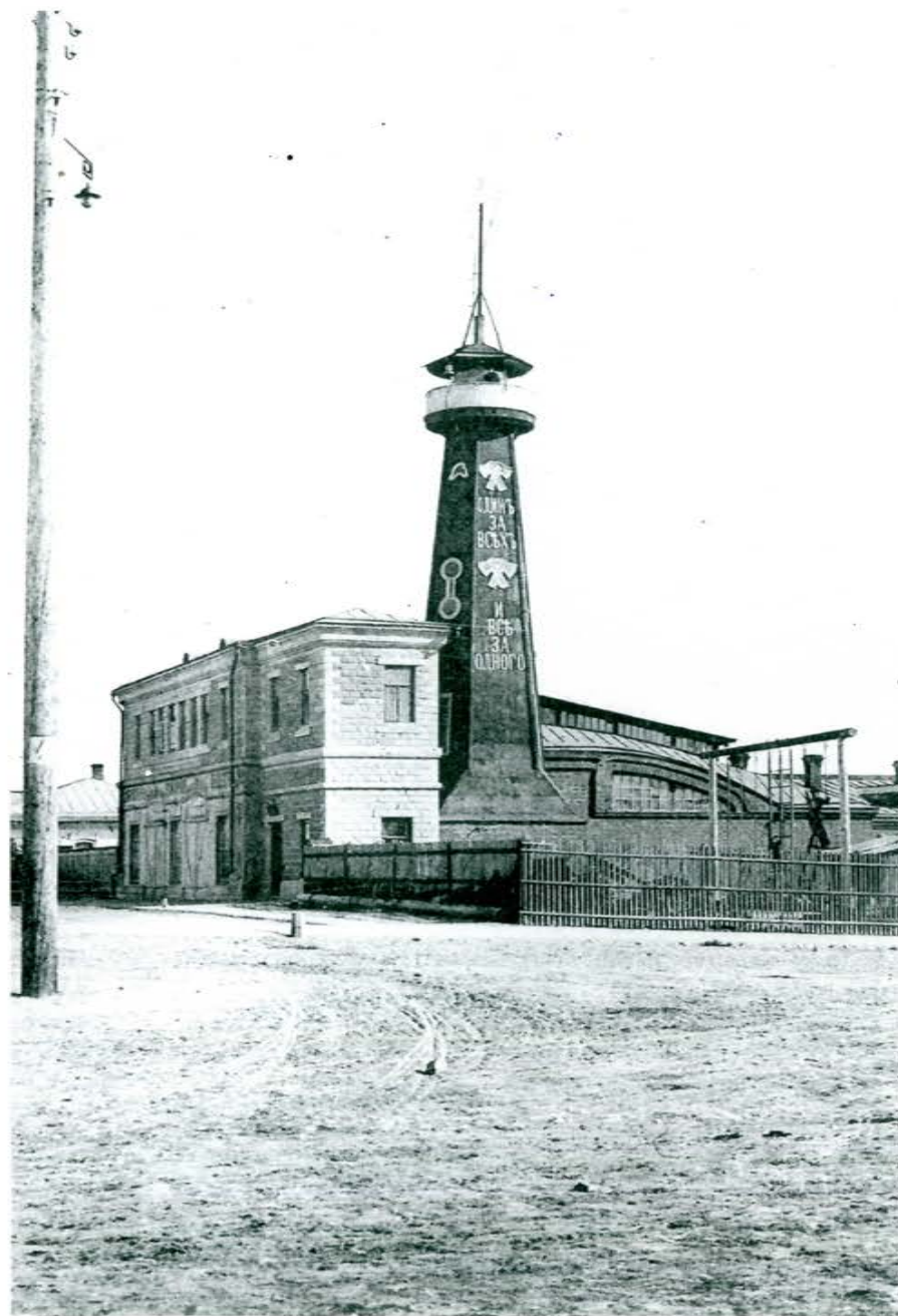
Здание ДПО в п. Новониколаевске, 1910 г.