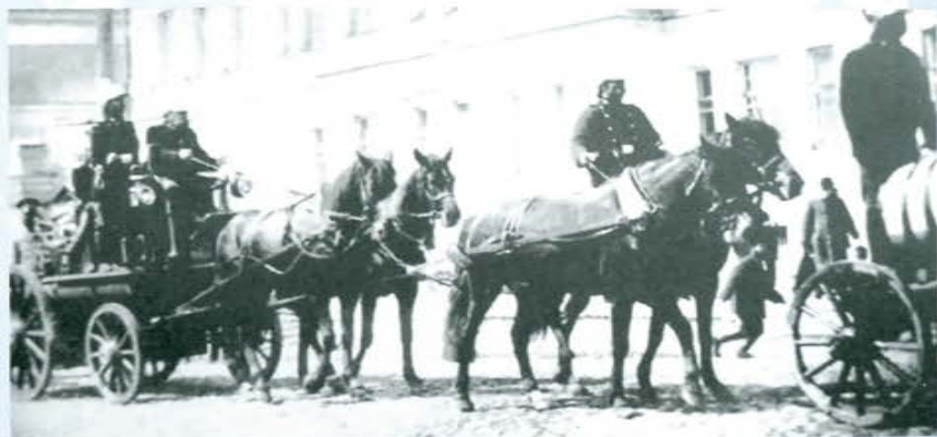
Выезд пожарных Екатеринбурга

11 мая 1849 г. при полицейской управе Екатеринбурга утверждается штат пожарных в 20 человек.