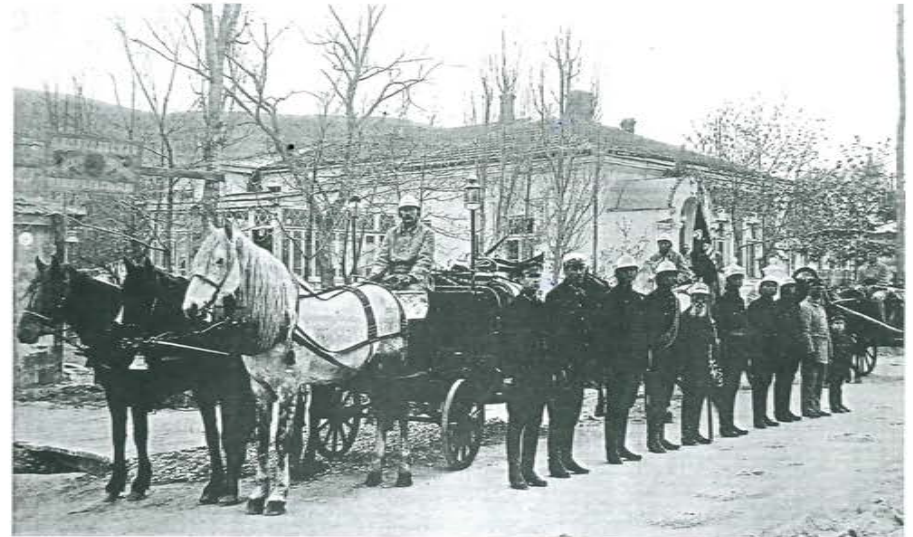
Балаклавская городская добровольная пожарная команда