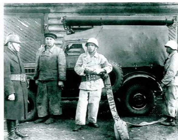
Муринское ДПО. Боевой расчет на занятиях