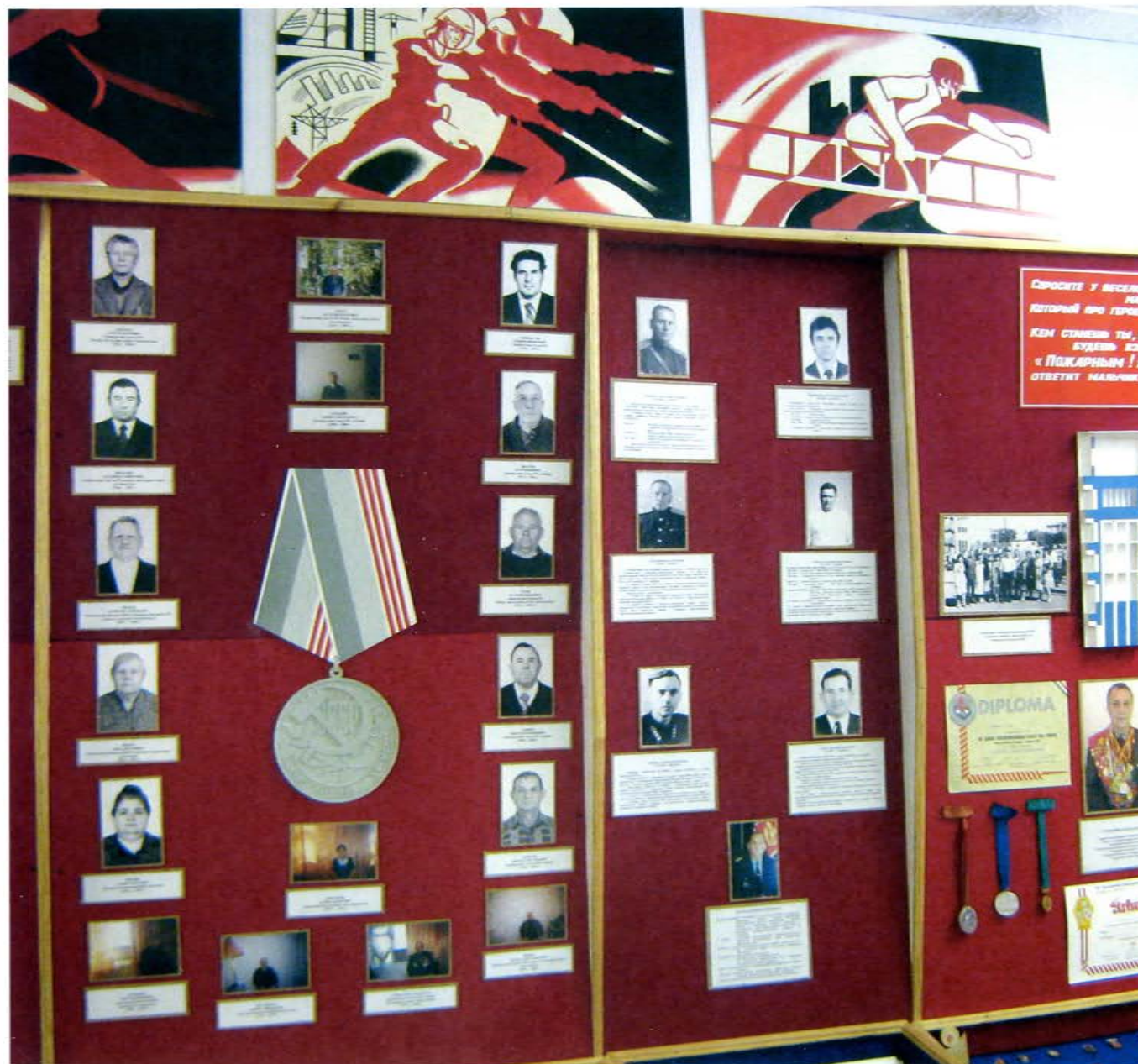
Стенд Музея истории добровольной пожарной охраны в г. Оренбурге

Впервые в Чебоксарах вопрос об организации пожарной службы был поставлен в 1806 г. Городская дума 28 мая приняла решение о постройке на торговой площади сараев для содержания пожарных орудий, о починке мостов, будок и дорог.