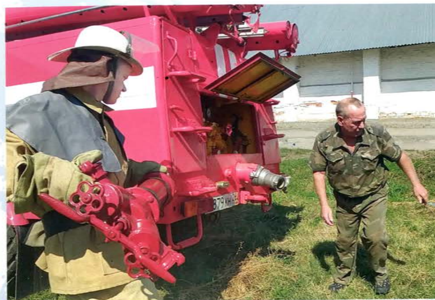
Отработка практики, Ставропольский край