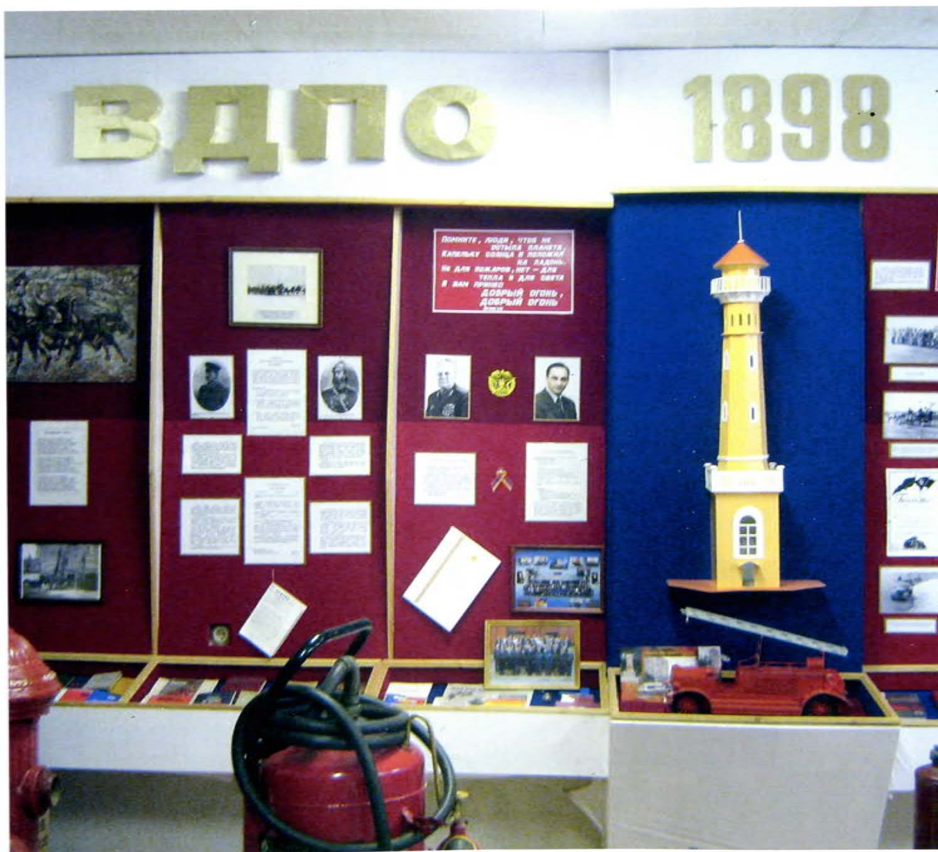
Более 30 лет Музей истории пожарной охраны Оренбурга принимает гостей