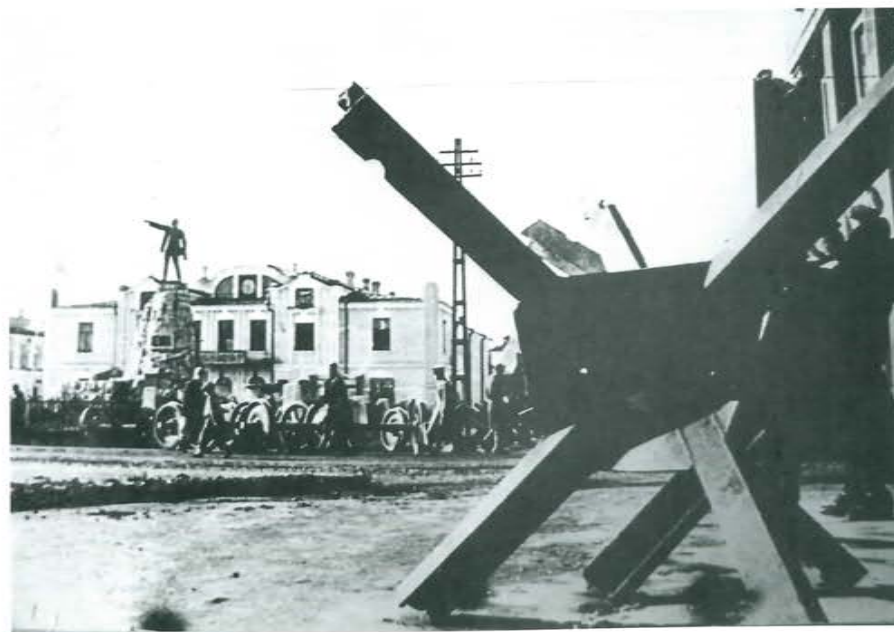
Северная Осетия – Алания