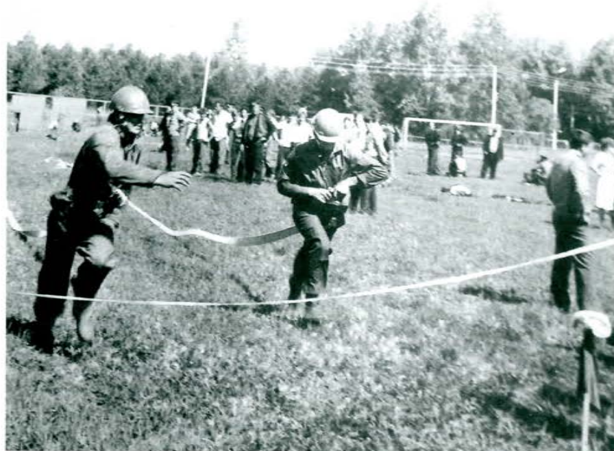
Соревнование ДПО, Амурская область, 1988 г.