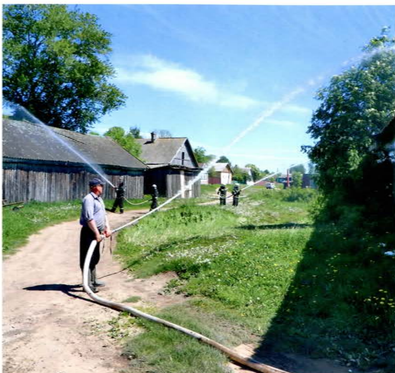
Учения ДПК на о. Залита Псковской области