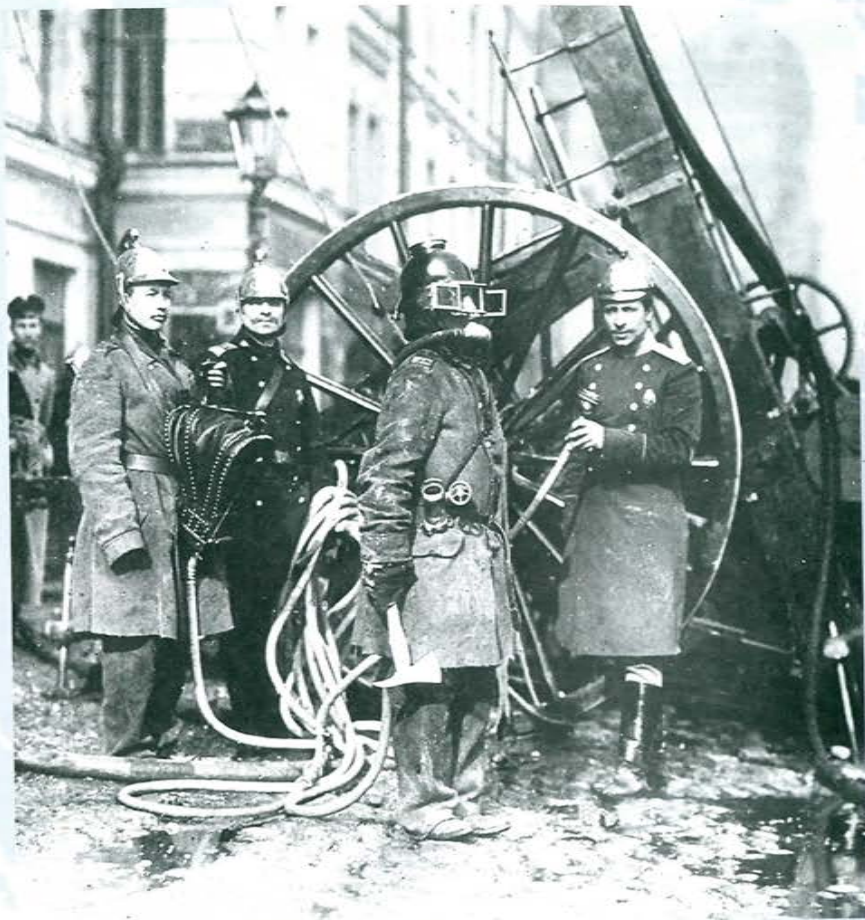
Добровольные пожарные г. Нальчика

4 апреля 1834 года командующий Кабардинской линией полковник Пирятинский издает «Открытое