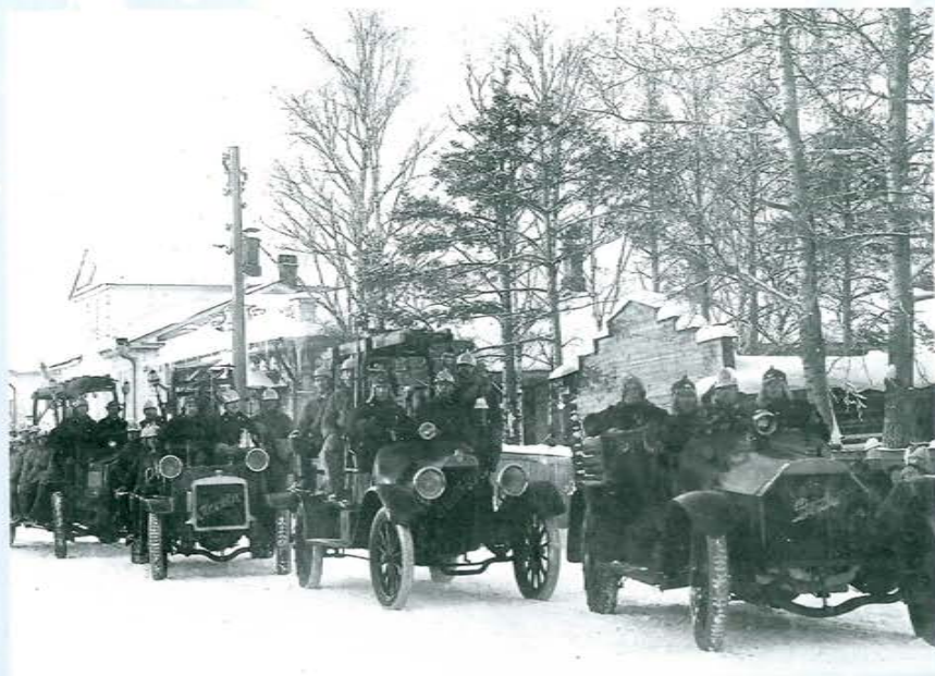
Первая городская пожарная часть г. Вятка, 1918 г.

16 декабря 1828 г. Николай I подписал Указ «Об устройстве полиции, пожарной части, доходах и расходах в губернском городе Вятке». Это первый документ, который, по мнению историков, содержит признаки организации профессиональной пожарной охраны в нынешнем городе Кирове.