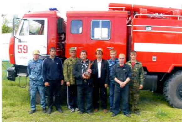
Соревнование ДПО Купинского района Новосибирской области