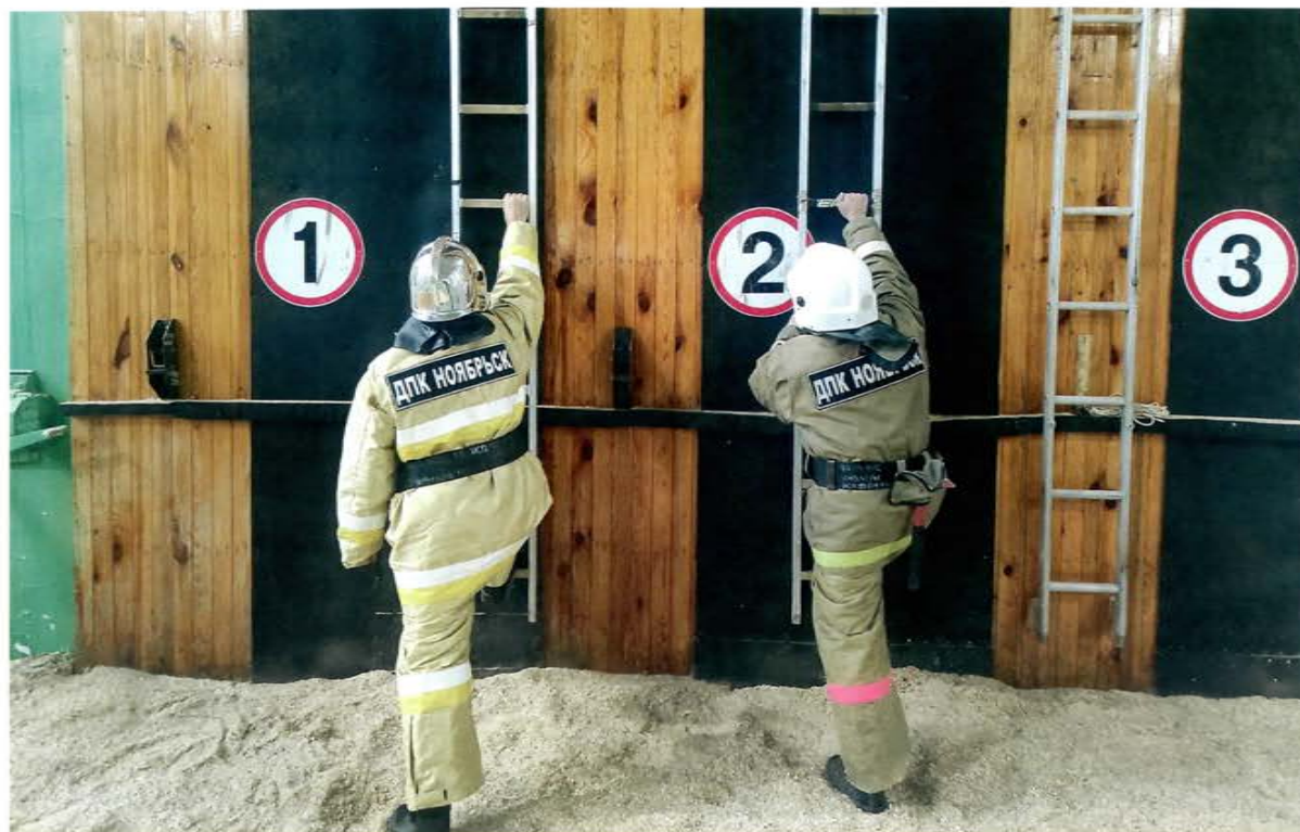
Учения ДПО, ЯНАО