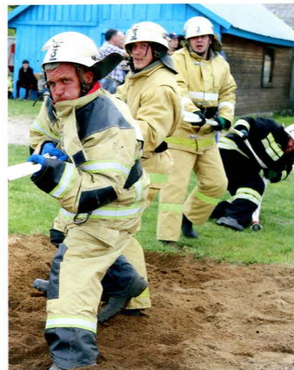
Кемерово. Смотр-конкурс «Лучшая ДПК Кузбасса»