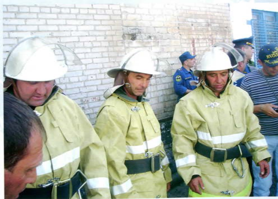
Соревнование ДПО, Кабардино-Балкарская Республика