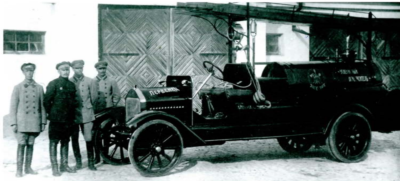
Автомобильный первенец. Крым

Становление пожарной охраны в Майкопе начинается с 1871 года.