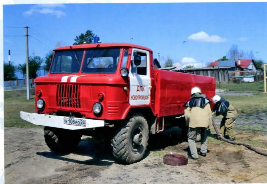
ДПК Новотроицкое и Мухинка

подразделений пожарной охраны, в которых организовано суточное дежурство добровольцев