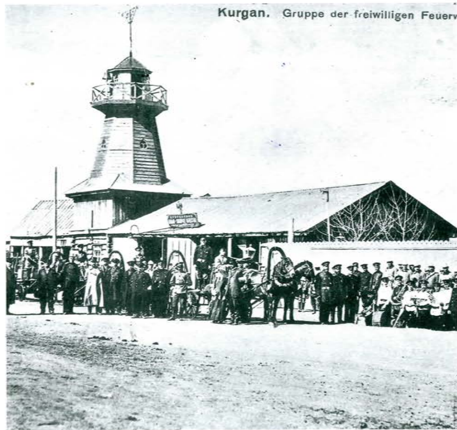
Группа добровольческого пожарного общества Кургана