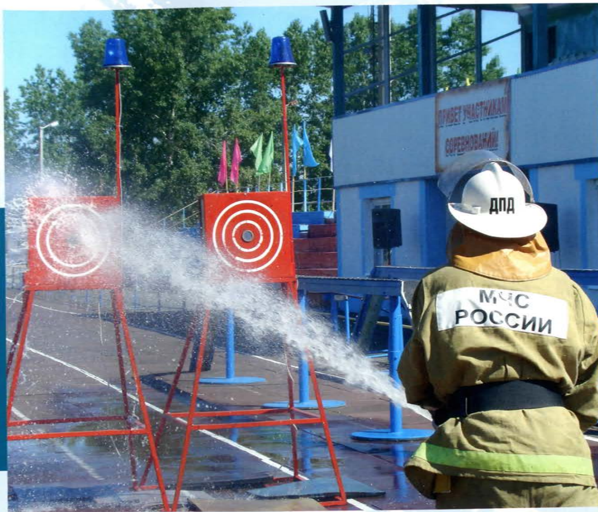
Алтайский край. Соревнования ДПК в селе Павловск