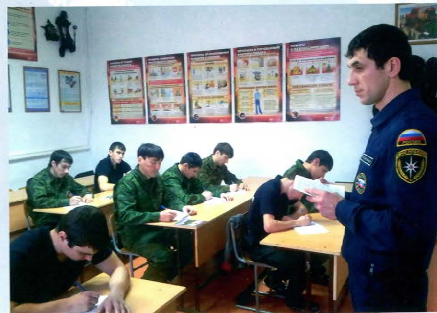
Занятие по теории, Ингушетия