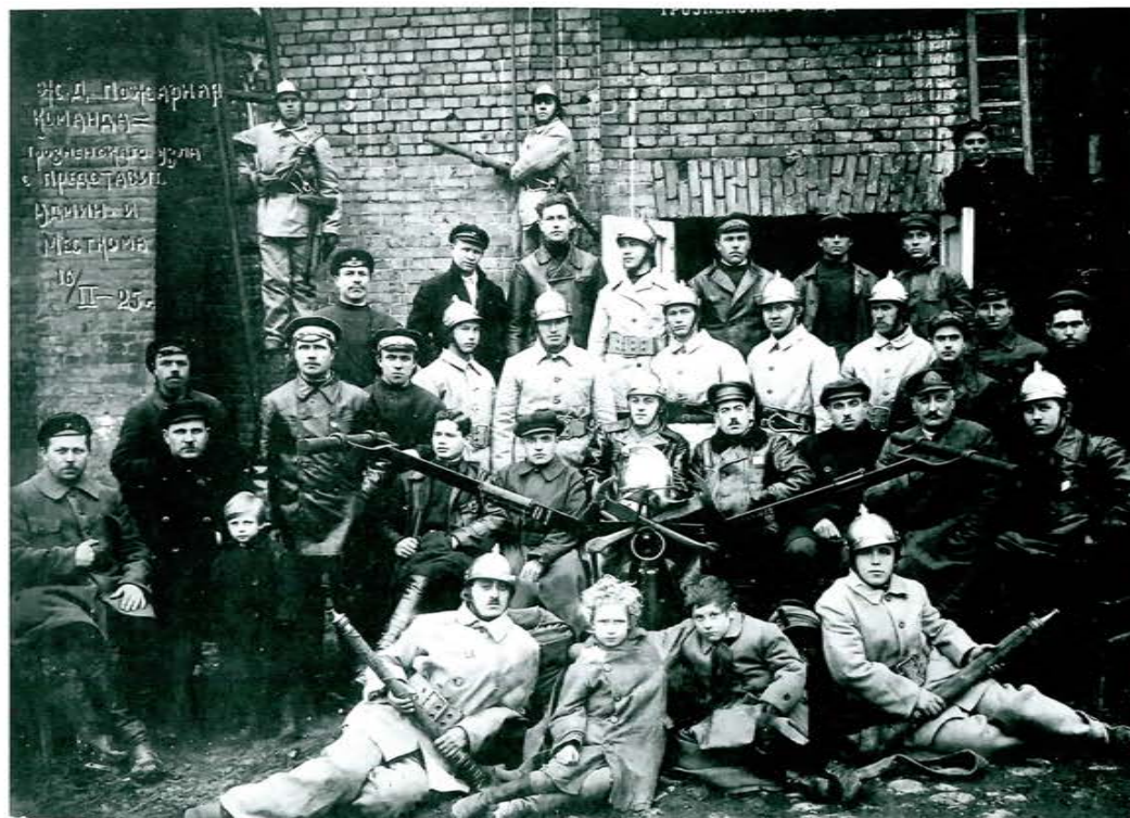
Ж/д пожарная команда Грозненского узла с представителями администрации и месткома, 1925 г.

История пожарной охраны Чеченской Республики начинается с момента зарождения в регионе нефтяного промысла и открытия нефтеперегонных заводов. Первая добровольная пожарная дружина была создана в 1917 году.