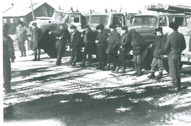
Красноярский край. Проверка состояния пожарной техники