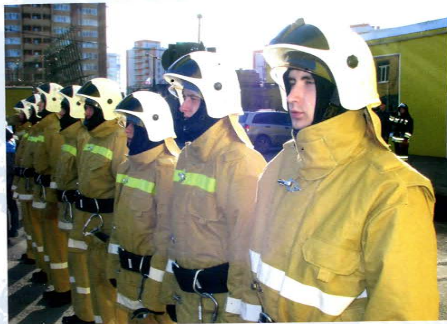
Красноярский край. ДСПСО Звезда, личный состав

подразделений пожарной охраны, в которых организовано суточное дежурство добровольцев