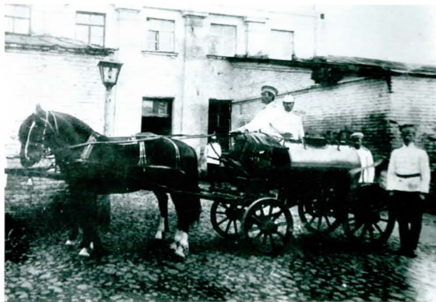
Севастопольские огнеборцы-добровольцы, 1910 г.