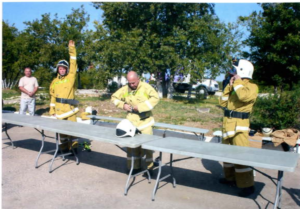
Смотр-конкурс добровольных пожарных Севастополя