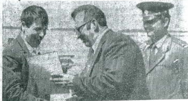
Вырезка из газеты «Сельский труженик», 1981 г., Новосибирская область