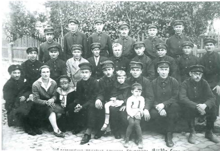
Крым. Добровольная пожарная дружина