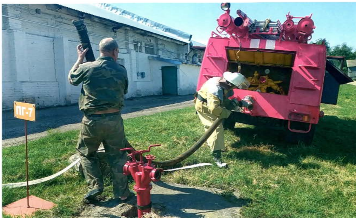
Практическое занятие по установке пожарного автомобиля на ПГДПК ООО «Хлебная база», Ставропольский край

Ежегодно Ставропольское краевое отделение ВДПО на обеспечение пожарной безопасности и социально ориентированную деятельность тратит порядка 5 миллионов рублей заработанных средств. Данные средства идут на издание полиграфической продукции в области пожарной безопасности. На проведение конкурсов, олимпиад, соревнований, фестивалей среди детей и молодежи, содержание юношеской сборной команды Ставропольского края по пожарно-спасательному спорту. Активно принимая участие в проводимых СКО ВДПО краевых конкурсах, олимпиадах, фестивалях и других мероприятиях в области пожарной безопасности школьники Ставропольского края неоднократно становились победителями Всероссийских этапов.