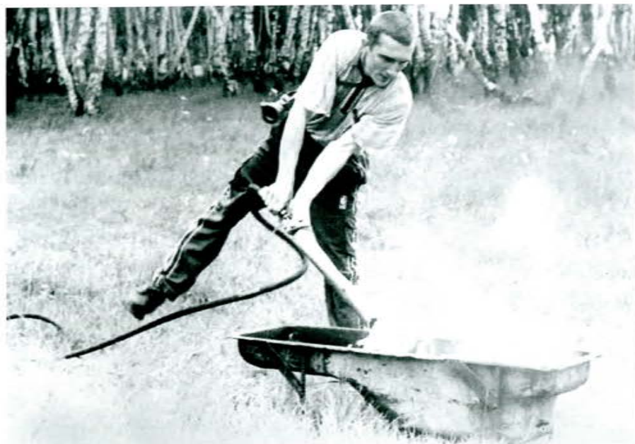
Соревнования по пожарно-прикладному спорту среди добровольных пожарных Баганского района