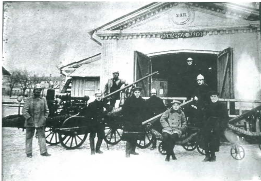
Крым. Пожарное депо