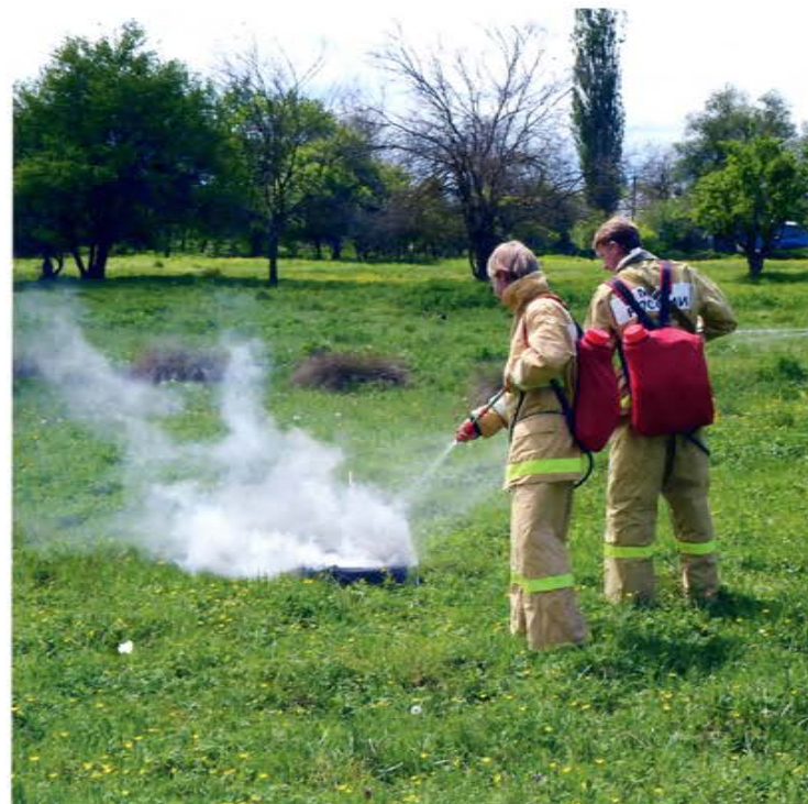
5-й отряд ДПК Краснодара