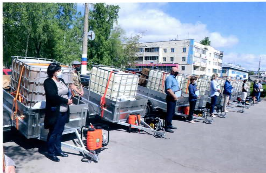
Немерово. Вручение техники ДПК