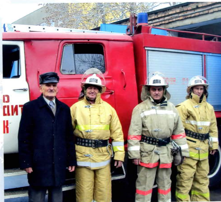
Северная Осетия – Алания

163 ← подразделения пожарной охраны, в которых организовано суточное дежурство добровольцев