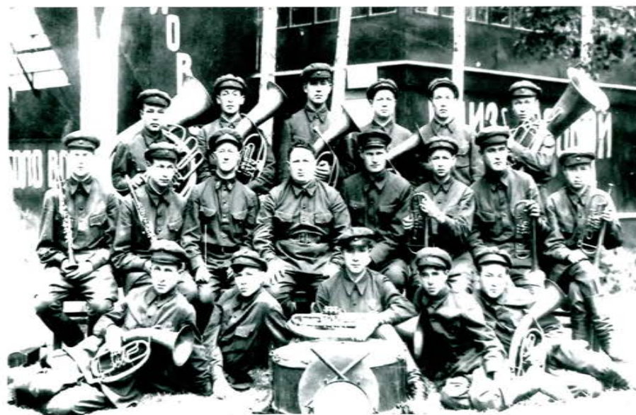
Духовой оркестр городского отдела пожарной охраны г. Новосибирска, 1935 г.