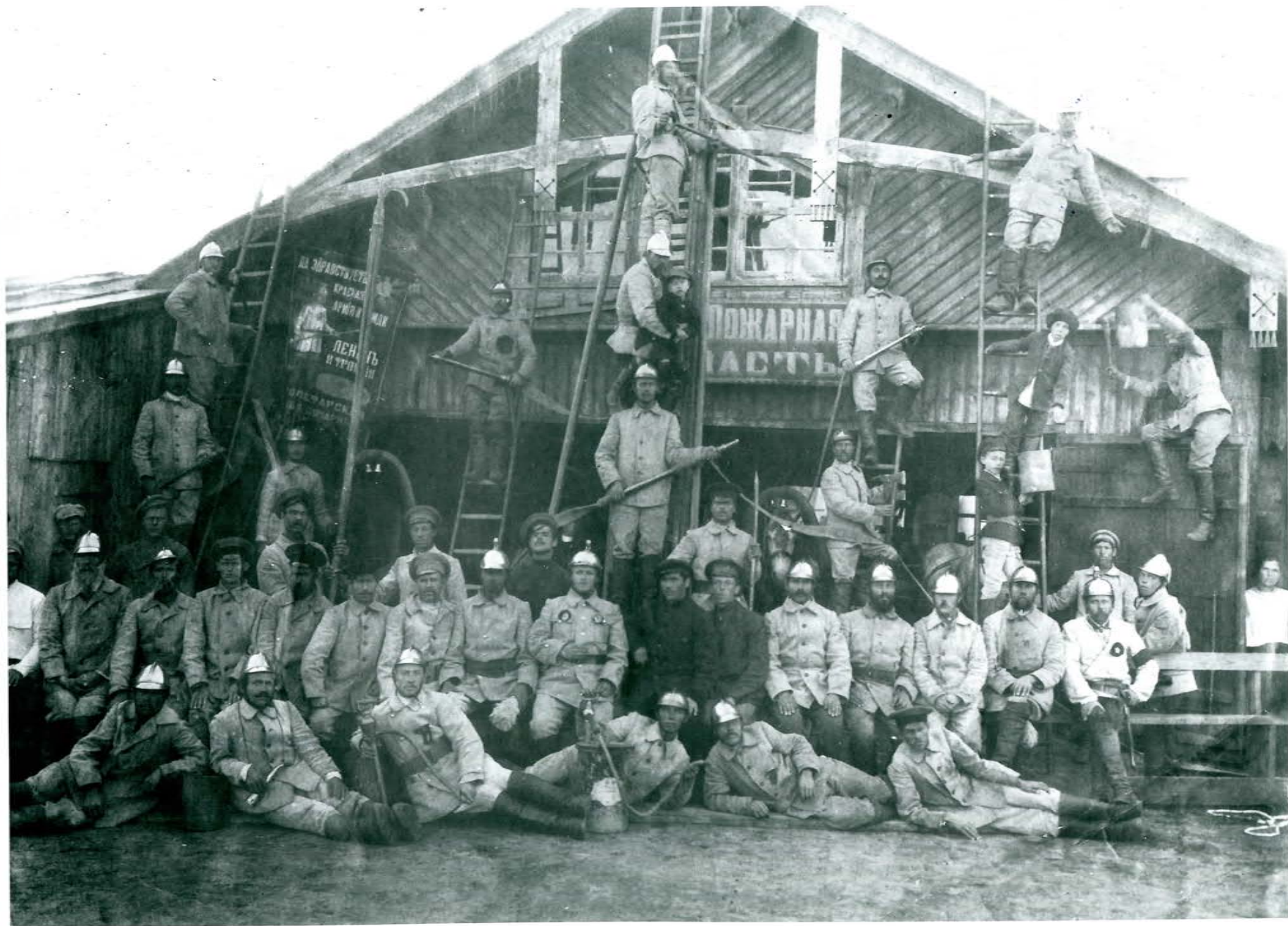
Команда пожарных частей г. Шадринска, 1920 г.