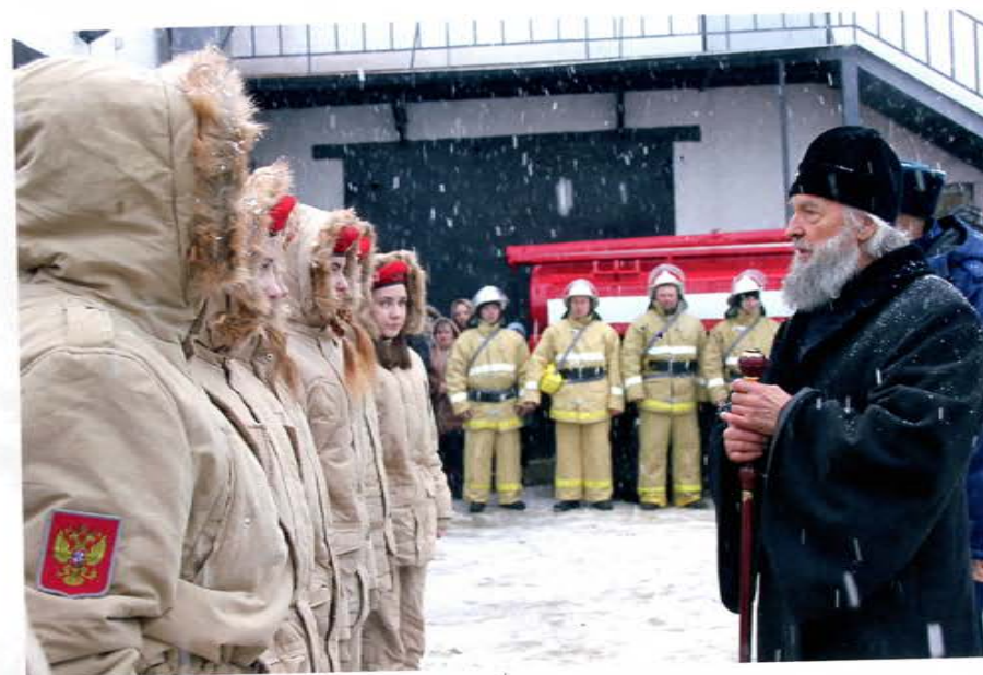
ДПК Щигры Курской области

подразделений пожарной охраны, в которых организовано суточное дежурство добровольцев