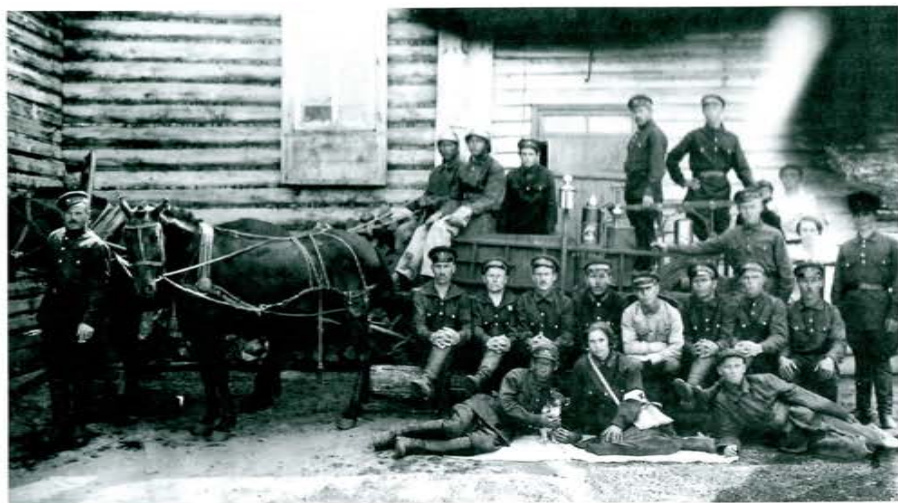
Пожарная команда Свердловской области, 1929 г.