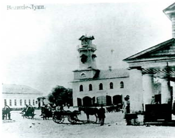
Великолукское пожарное депо, 1887 г.