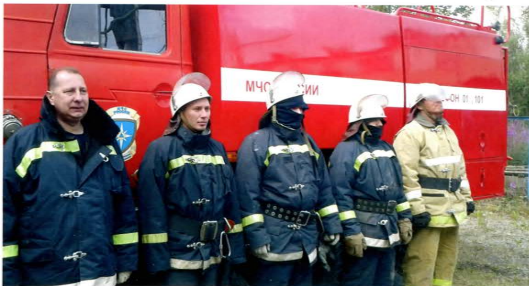
Чукотский АО. Добровольцы

В рамках муниципальной программы «Пожарная безопасность» все добровольные пожарные дружины на территории Партизанского городского округа получили новое снаряжение. При этом добровольные пожарные – это не только силы быстрого реагирования при обнаружении и тушении пожара, это еще и специалисты в вопросах профилактики нарушений пожарной безопасности на территориях, обеспечивающие своевременное предупреждение и недопущение возникновения возгораний. Подразделения добровольной пожарной охраны в Приморье 126 раз участвовали в тушении пожаров, помогли тушить 100 природных пожаров и 26 техногенных.