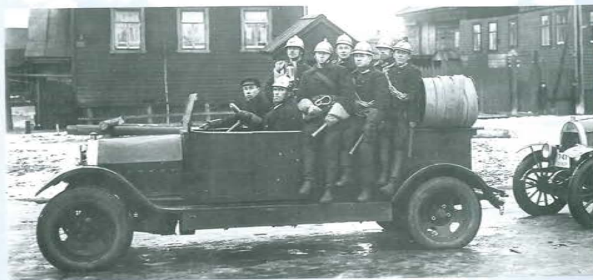
Первая соломбальская ДПД, 1936 г.

Отправной точкой организации пожарной охраны на Русском Севере считается 30 июля 1866 г., когда постановлением городской думы в Архангельске создается городская пожарная команда.