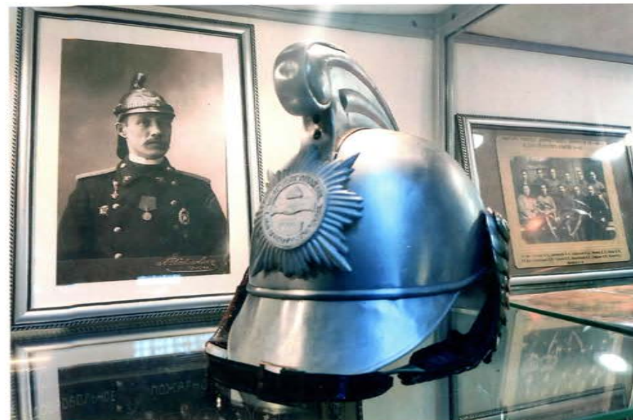
Наградная каска пожарного от Томского добровольного пожарного общества, 1923 г.