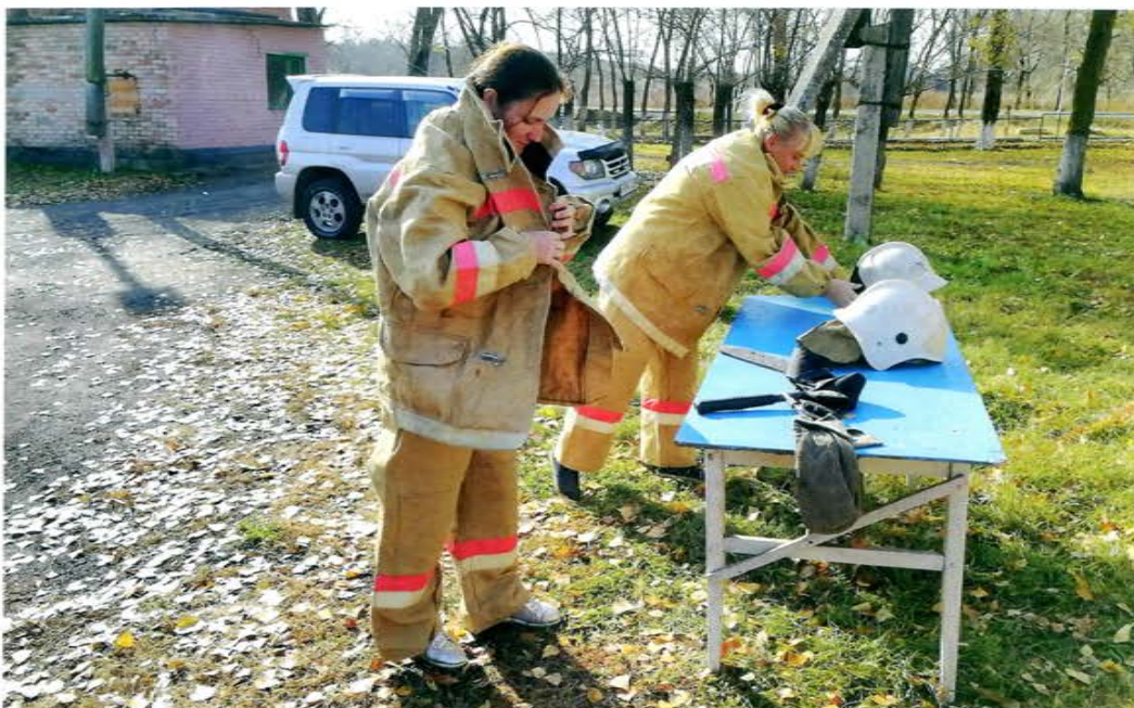
Приморск. ДПК Октябрьского сельского поселения. Внутренние соревнования, 2018 г.